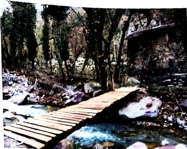
Reconstruction d'un pont pour un particulier.

A ce jour, l'Association est en plein développement et a pour objectif d'être présente auprès des sinistrés des vallées des Alpes-Maritimes. Mission Trek-